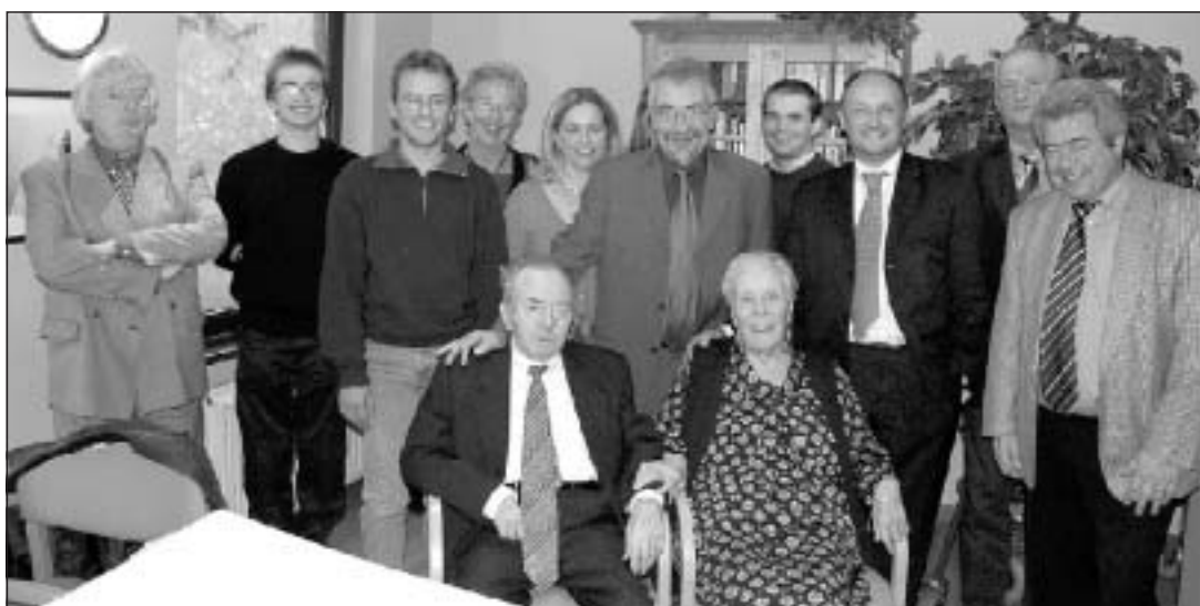
Les heureux jubilaires entourés de leur famille et des édiles silliens. CE D.P. 579677

Émus, les sympathiques époux expliquent qu'ils se connaissent depuis toujours : « A partir de l'école maternelle, nous avons été dans la même classe ; nous avons aussi fait notre communion ensemble. Ensuite, nous nous sommes un peu perdus de vue avant de nous retrouver... définitivement.