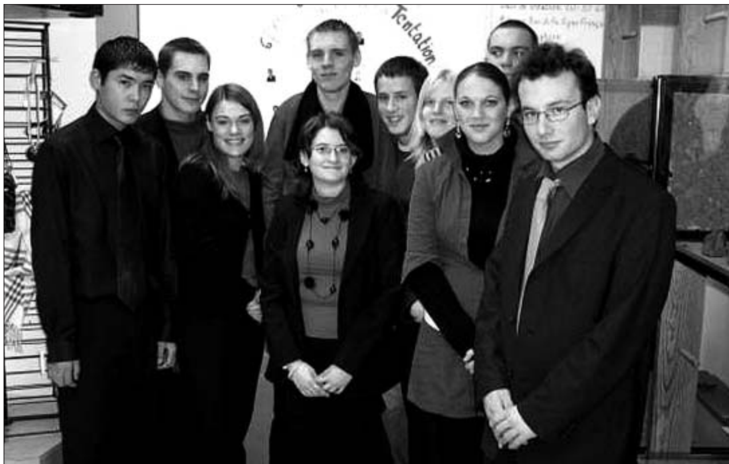
« 6 filles et 6 garçons pour succomber à la tentation », tel est le slogan des 12 membres du personnel administratif de la mini-entreprise « Tentation ». CE F.S. 575628

« Au départ, nous contactons différents fournisseurs pour choisir des produits aux